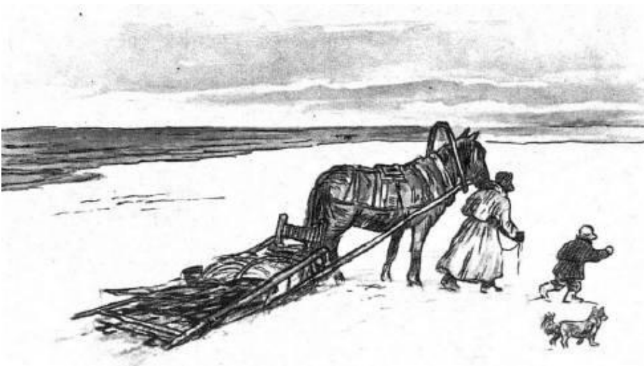
Иллюстрации О. Демидовой https://deti123.ru/rasskaz/na-ldine