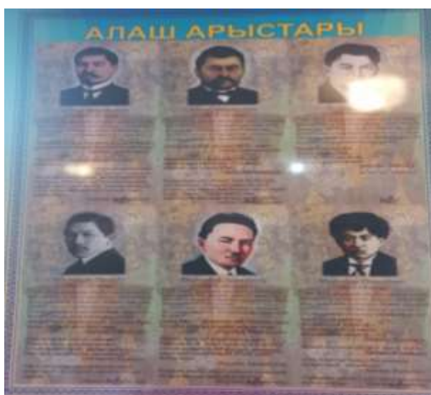
(Тарих кабинеті, стенд)

«Сыни ойлау арқылы ұлттық құндылыққа негізделген білім беруге болама?» атты тақырыбы алынды. Бұл жерде айтарымыз әр пәннің әр сабағында ұлттық құндылықты негізгі тірек ретінде пайдаланып жас ұрпақты саналы және сапалы етіп болашаққа дайындау. Мектеп қабырғасында берілген білім мен тәрбие баланың дұрыс қалыптасуының кепілі болғандықтан Әлихан Бөкейханов сынды ұлт көсемінің және оның айналасындағы зиялылардың өнеге ісі мен ізгі қасиеттері тәрбие беруде негізгі құралы. Мектебіміздің ішінде алаш арыстарының нақыл сөздері жазылған стендтерді көптеп кездестіруге болады. Ол да оқушыларға тұлғалық қалыптасуына септігін тигізсін деген мақсатта жасалған әдістің бір көрінісі іспеттес. Соның бірін ұсынсам: